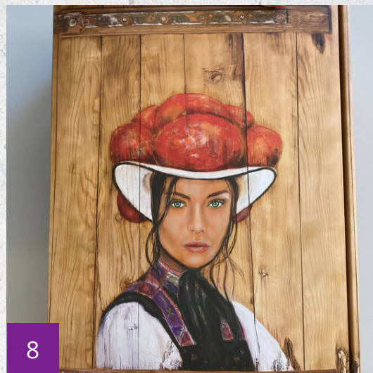
Der Weinkarton ist fertig gefaltet The wine box is ready folded