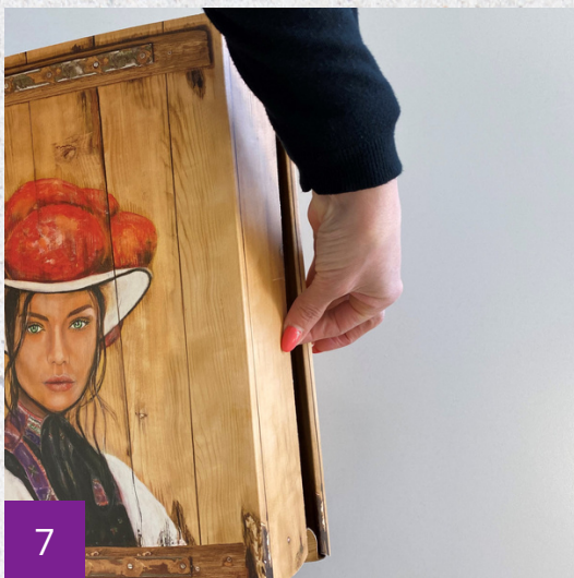
Einstecken des Deckels Inserting the cover