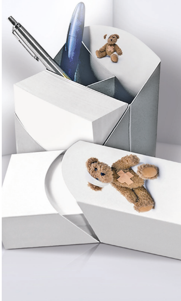
Kartonbox KB 08 Cardboard box KB 08