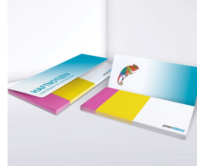
Haftset P 22 im Kartonumschlag Adhesive set P 22 with cardboard cover