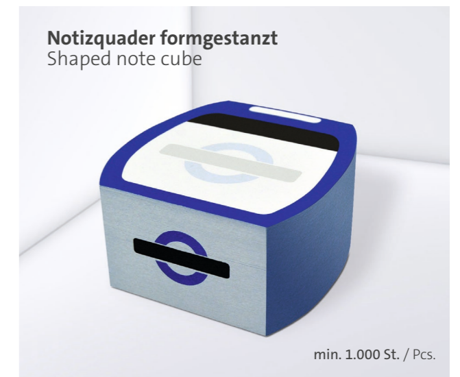
Notizquader formgestanzt Shaped note cube

Optional Einzelblattdruck 1- bis 4-farbig Offset Optional single-sheet print 1- up to 4-coloured offset