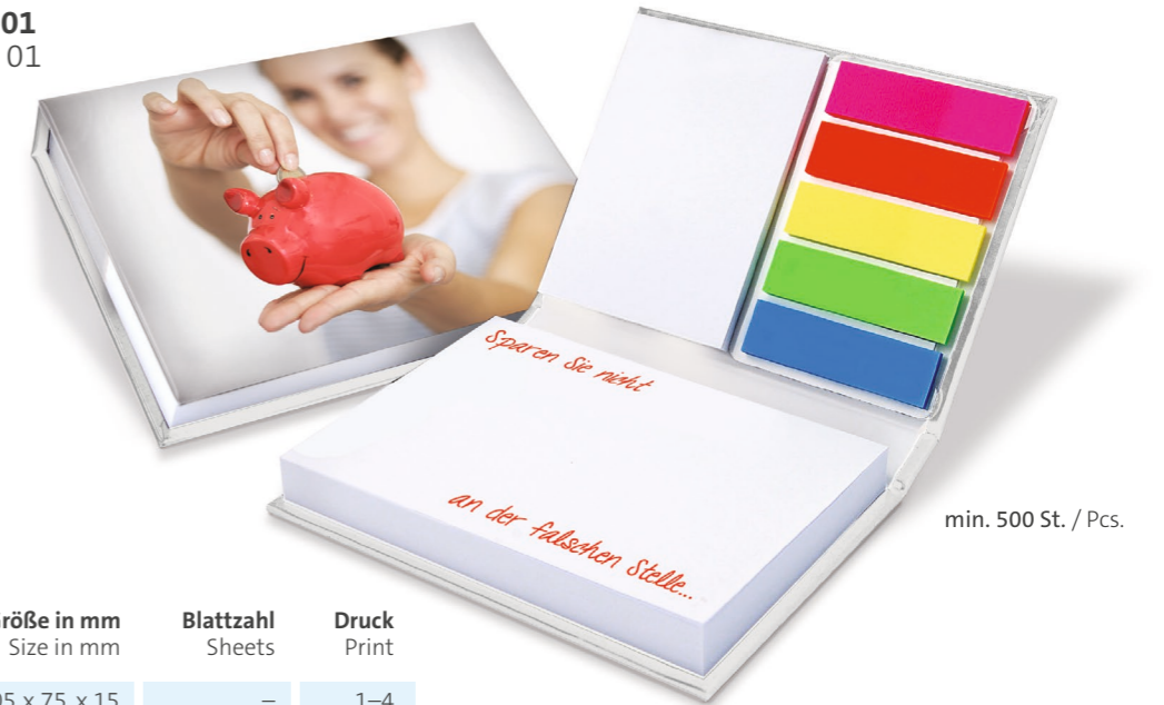
Hardcoverset PK 01 Hardcover set PK 01

Our premium hardcover sets are just as versatile as they are popular. Chic and compact, they hold all manner of things you need on your desk: small note pads, colourful self-adhesive page markers, and a desk calendar if you wish. Take advantage of the opportunities this great promotional gift offers and put your advertising permanently in front of your target group.