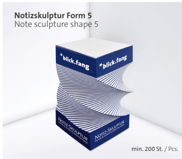
Notizskulptur Form 5 Note sculpture shape 5