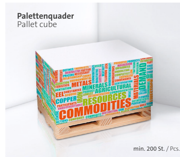
Palettenquader Pallet cube

Optional Einzelblattdruck 1- bis 4-farbig Offset Optional single-sheet print 1- up to 4-coloured offset