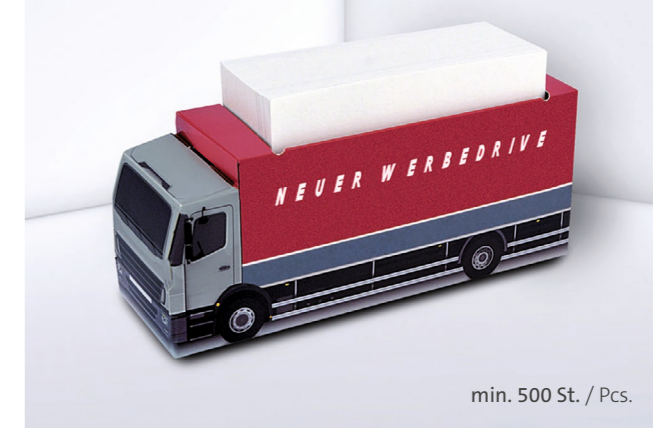
Kartonbox KB 16 LKW Cardboard box KB 16 Truck