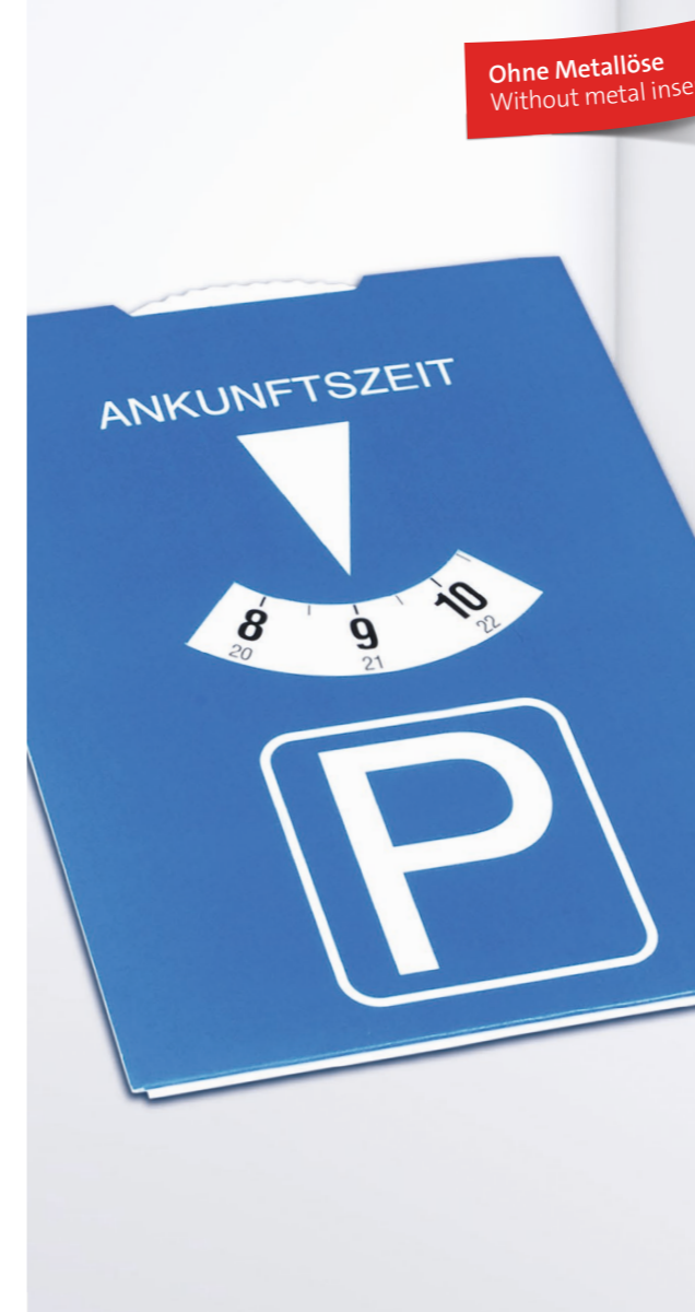
Parkscheibe aus Karton Parking disk made of cardboard