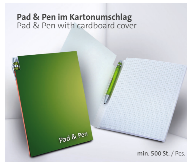
Pad & Pen im Kartonumschlag Pad & Pen with cardboard cover

Unterstrichenes Maß = Leimseite Underlined dimension = Glued side