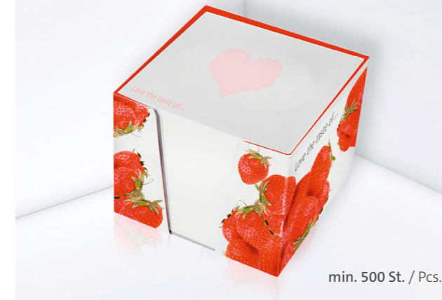
Kartonbox KB 01 Cardboard box KB 01

Place yourself in front of your customers any time they pause for thought with our note boxes. With the choice of options we offer, there is something for everyone. Be it sustainable paper, a useful tool, or a truck-shaped box: we offer exciting novelties and tried-and-tested classics.