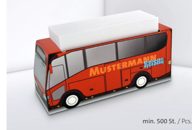
Kartonbox KB 17 Bus Cardboard box KB 17 Bus

Individuelle Formen auf Anfrage Individual shapes on request