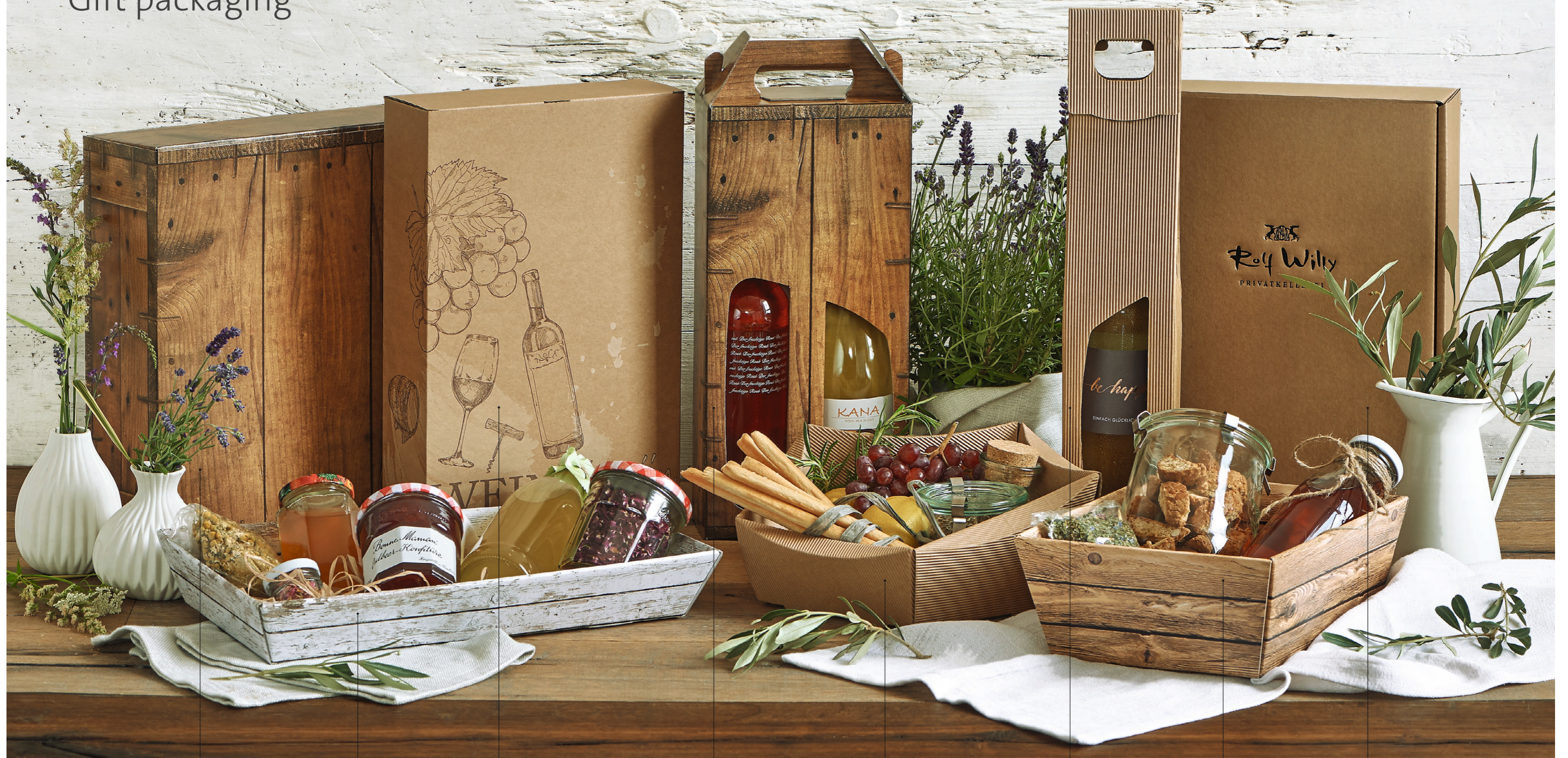
Holz kiste Rustikal Weinpräsentkarton Holz kiste Rustikal Wine gift carton