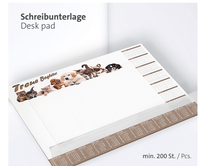
Schreibunterlage Desk pad