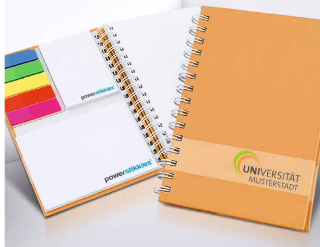
Hardcover-Collegeset PK 02 Spiral note pad set with hardcover PK 02