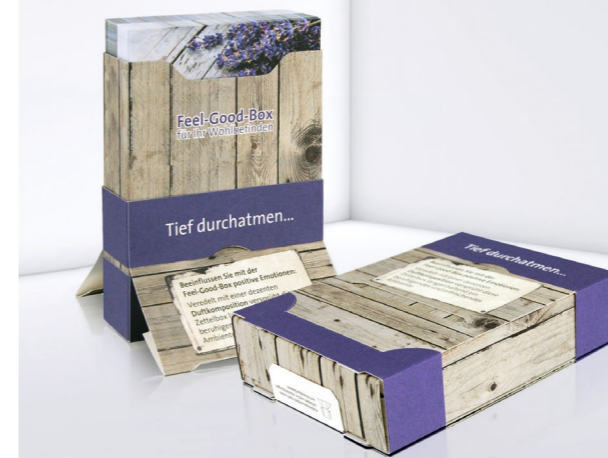
Kartonbox KB 05 Cardboard box KB 05