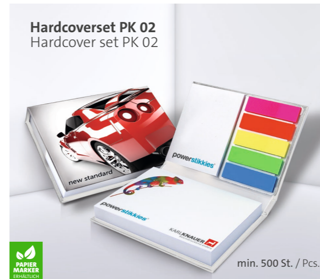
Hardcoverset PK 02 Hardcover set PK 02