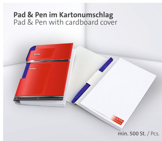
Pad & Pen im Kartonumschlag Pad & Pen with cardboard cover

Optional mit PP-Deck- und Bodenblatt Optional with plastic front cover and base sheet