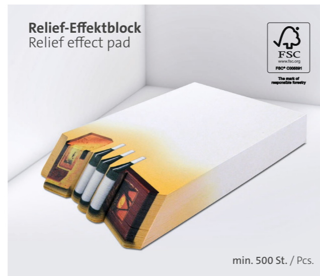
Relief-Effektblock Relief effect pad