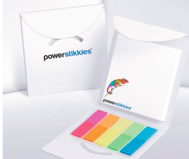
Haftset PK 16 mit Kartonverschluss Adhesive set PK 16 with cardboard clasp