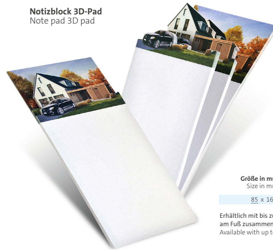
Notizblock 3D-Pad Note pad 3D pad