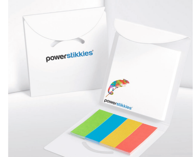
Papiermarker PM 04 mit Kartonverschluss Paper markers PM 04 with cardboard clasp