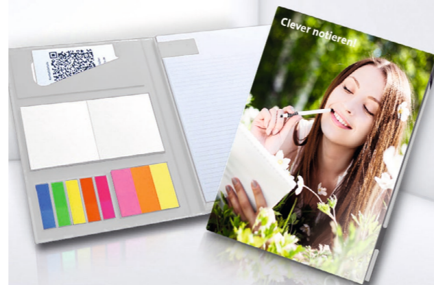
Hardcoverset PK 05 Hardcover set PK 05