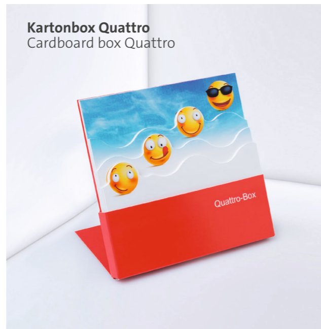
Kartonbox Quattro Cardboard box Quattro