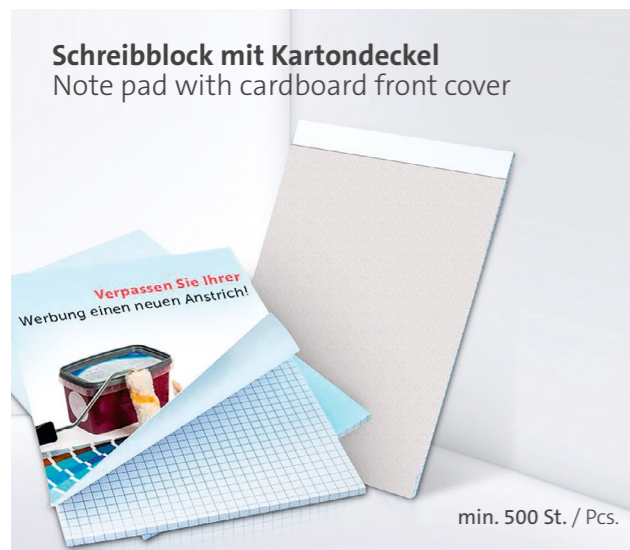
Schreibblock mit Kartondeckel Note pad with cardboard front cover