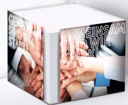
Kartonbox KB 07 Cardboard box KB 07