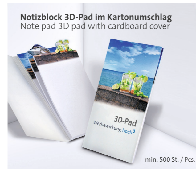
Notizblock 3D-Pad im Kartonumschlag Note pad 3D pad with cardboard cover