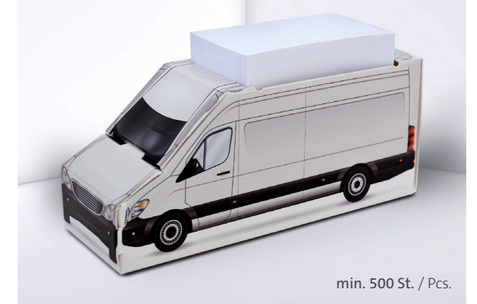
Kartonbox KB 18 Transporter Cardboard box KB 18 Van

Individuelle Formen auf Anfrage Individual shapes on request