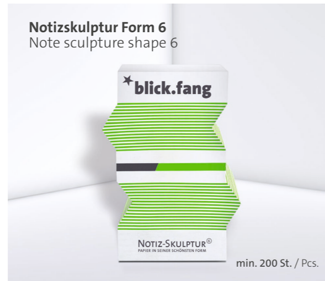
Notizskulptur Form 6 Note sculpture shape 6