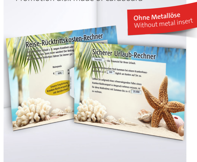
Drehscheibe aus Karton Promotion disk made of cardboard