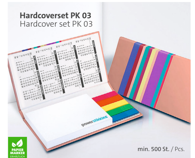
Hardcoverset PK 03 Hardcover set PK 03

Unterstrichenes Maß = Haftseite Underlined dimension = Adhesive side