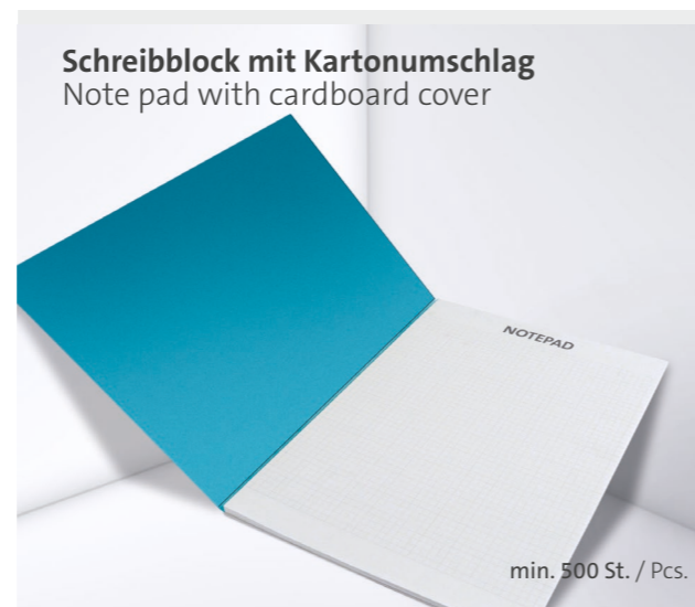
Schreibblock mit Kartonumschlag Note pad with cardboard cover