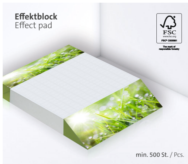
Effektblock Effect pad

Erhältlich mit bis zu vier Notizblöcken à 20 Blatt, am Fuß zusammengeleimt. Available with up to four pads, glued together at the bottom.