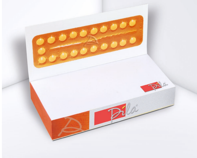
Haftnotizen als Produktnachbildung Adhesive notes as product imitation