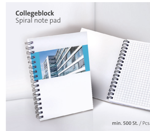
Collegeblock Spiral note pad