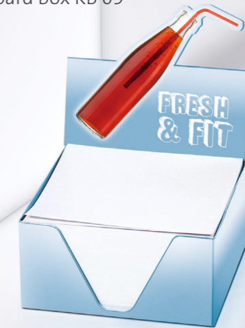
Kartonbox KB 09 Cardboard box KB 09