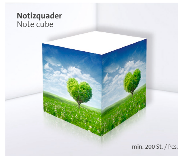
Notizquader Note cube

Note cubes with a modern edge. Printed on four sides with your choice of motif, twisted into a sculpture, punched, staggered, or supplied with an integrated pen: the classic note cube now comes in all sorts of shapes and sizes. But don't worry if you prefer conventional writing pads—we can provide whatever you wish for in this respect too.