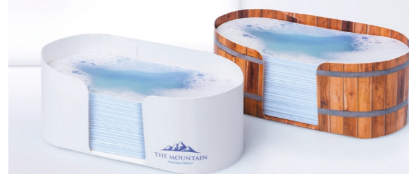
Kartonbox KB 03 „Panorama“ Cardboard box KB 03 „Panorama“