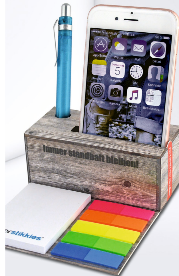
Haftset PK 12 Smartphonehalter Adhesive set PK 12 Smartphone holder