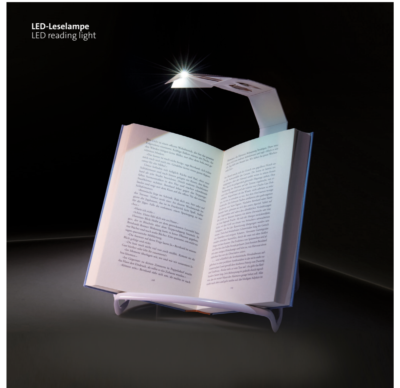
LED-Leselampe LED reading light