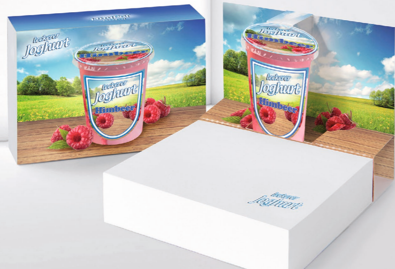
Haftnotizen im Effektschlag Adhesive notes with effect cover